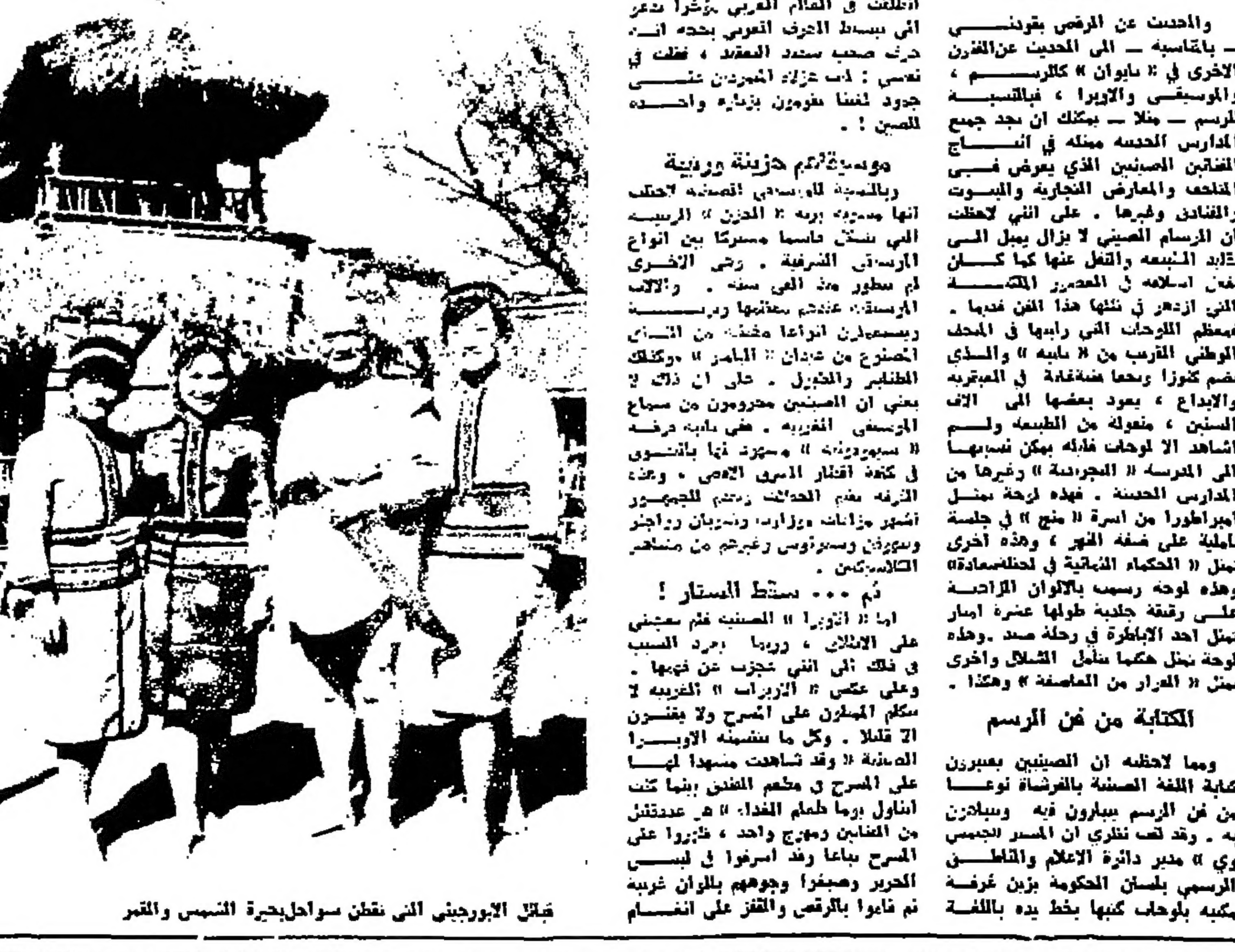
قبائل الابورجيني التي تظن سواحل بحيرة الشمس والقمير

حديث عن الرسم والحدث عن الرسم بقرنيس - ياتقاسمه - الى الحديث عن القرن الاجري في « تايوان » كالرسم والجوسفي والايروا ، والبياسية الرسم - مثلا - بذلك ان جدم ججم الدارس الحسنة منته في اسناج الضمان الصيني الذي يعرض في الخطف والمعارض التجارية والبسوت والفنانك وغيرها . على اني لاعتقت ان الرسم الصيني لا يزال يملك تأثيره الاثني والقل عنها كما كان من اسلافه في العصر القديم الذي ازدهر في تلكا هذا الفن فيها . ويستعملون اوتاعة فخذ من الشاي الاصغر من عدان « البامر » و « كوكك الطاني والشرول - حل ان ذلك يعني ان الصينيين حرمون من سواج الرجسي الغربي . في ايديه وفيه « سبورون » « سبورون » « سبورون » في كفة اقطار الحدي الاممي . وفيه الرفعة من الحدي رشم الجوسفور تسهر من اوقات وزارة ، وسيزان رواجز وسيزان وسيزان وسيزان من مسافر الاصغر . ثم ... بسط الستار ابا - ان « تايوان » الصين فم معنى على الاطلاق ، وربما برعد السبب في ذلك اني ججرت عن فيها . وعلى عكس « التايوان » الغربية لا سكلم المليون على المسرح ولا يقترون ان قتلا . وكل ما سببه الاوسرا الصينية « وقد شاهدت منها لهما على المسرح في معظم المدن بينما كنت اناول برما طعام الغداء . هر عدتلك من الضمان وهو ج واحد ، فترروا على المسرح بناغا وقد اسرخوا في لبس الحري وصفا ووجههم بلوان غريبة ثم ناولوا بالقرص والقرص على التماس